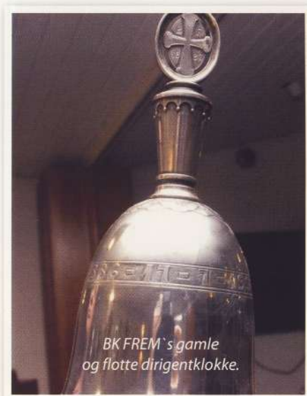
BK FREM's gamle og flotte dirigentklokke.