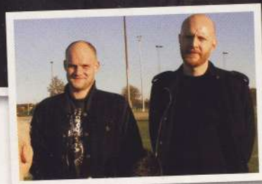
Af Tim P. Thomsen / Søren Gelineck

Frem indledte sæsonen i uvished. Mange nye spillere, ny cheftrener og to oprykninger på lige så mange år, resulterede i en forsigtig målsætning om overlevelse i 2. division. Med en øjeblikkelig 4. plads og 15 point ned til nedrykningsstregen må den målsætning siges at være opfyldt. Vi har derfor sat os ned med trænerstaben for at få at tage en snak om deres syn på Frem's retur til divisionerne