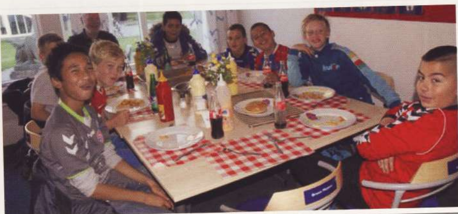
BK FREM's bold drenge ved 1. holdets hjemmekampe.