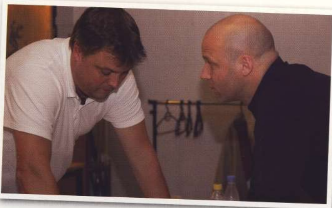
Formand & næstformand ordner de sidste detaljer

Budgettet blev herefter enstemmigt godkendt!