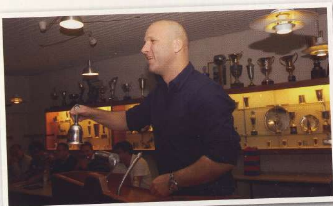
Formanden åbner FREM's generalforsamling.

Økonomi: Tak til sponsorerne som vi heldigvis har mange af iforhold til andre klubber på samme niveau.