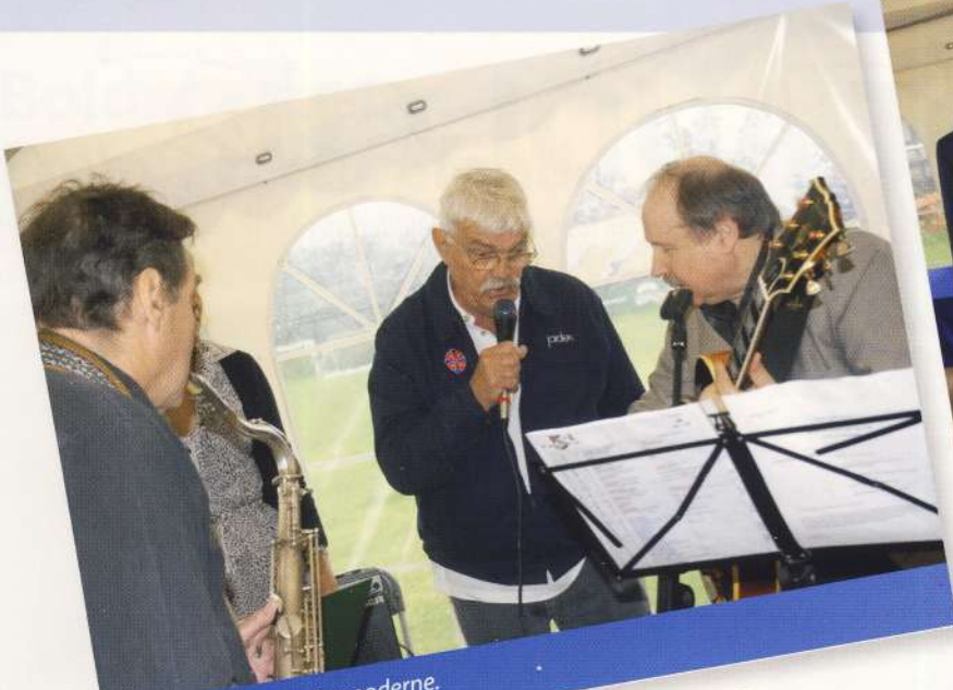
Damgaard leder efter noderne.