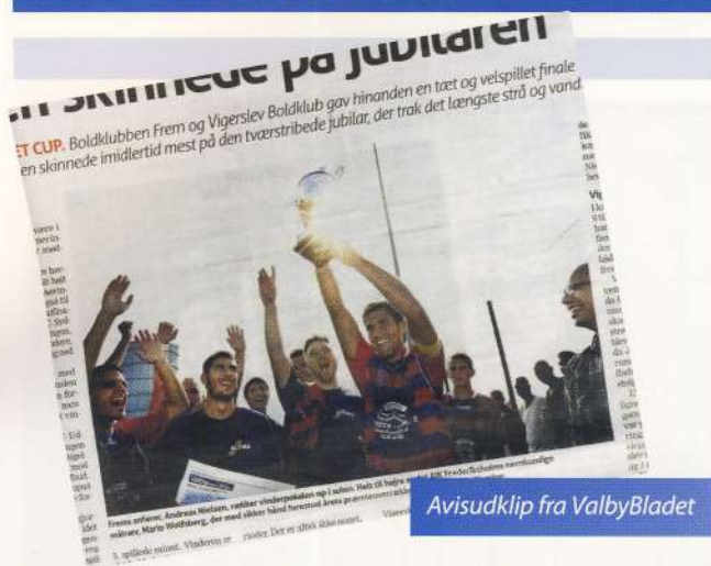
Avisudklip fra Valby Bladet