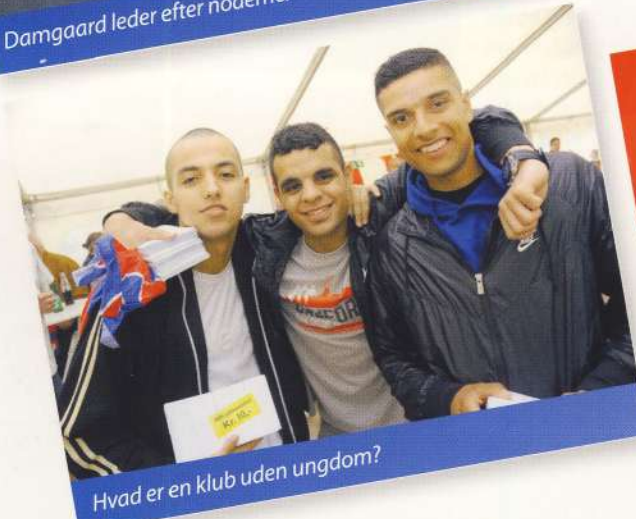
Hvad er en klub uden ungdom?