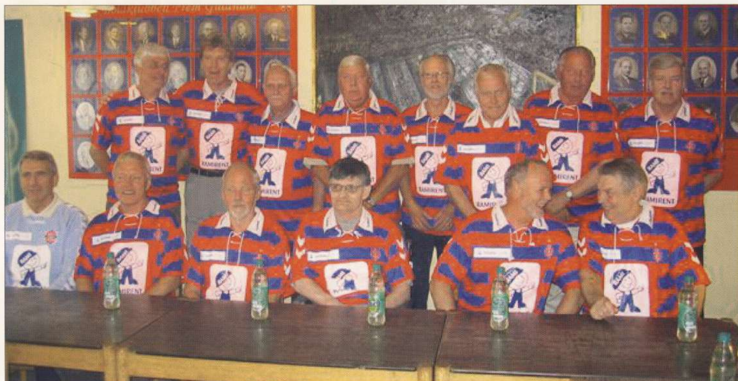
Holdet fra 1964 – anno 2005.