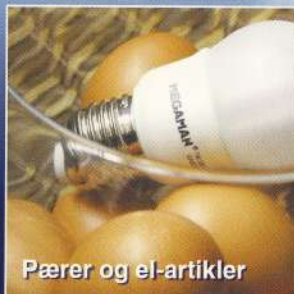
Pærer og el-artikler