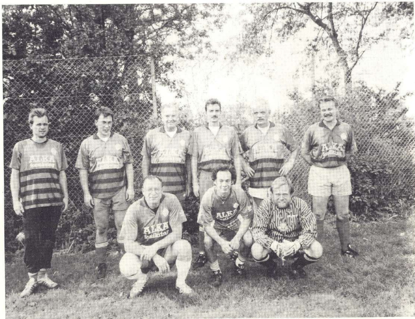
Jægerholdet i en af deres første kampe.

Der arbejdes stadig på højtryk for at få etableret et kombineret fodbold og håndbold stævne i samarbejde med vores gode venner fra Ajax København. Stævnet er programsat til den 8 - 13. juli 1996, og der estimeres med ca. 5.000 deltagere. Bliver stævnet en realitet får Boldklubben Frem og Ajax København brug for alle de hjælpende hænder, der er i klubberne. Medlemmerne vil blive orienteret, når der er nyt fra organisationskomiteen.