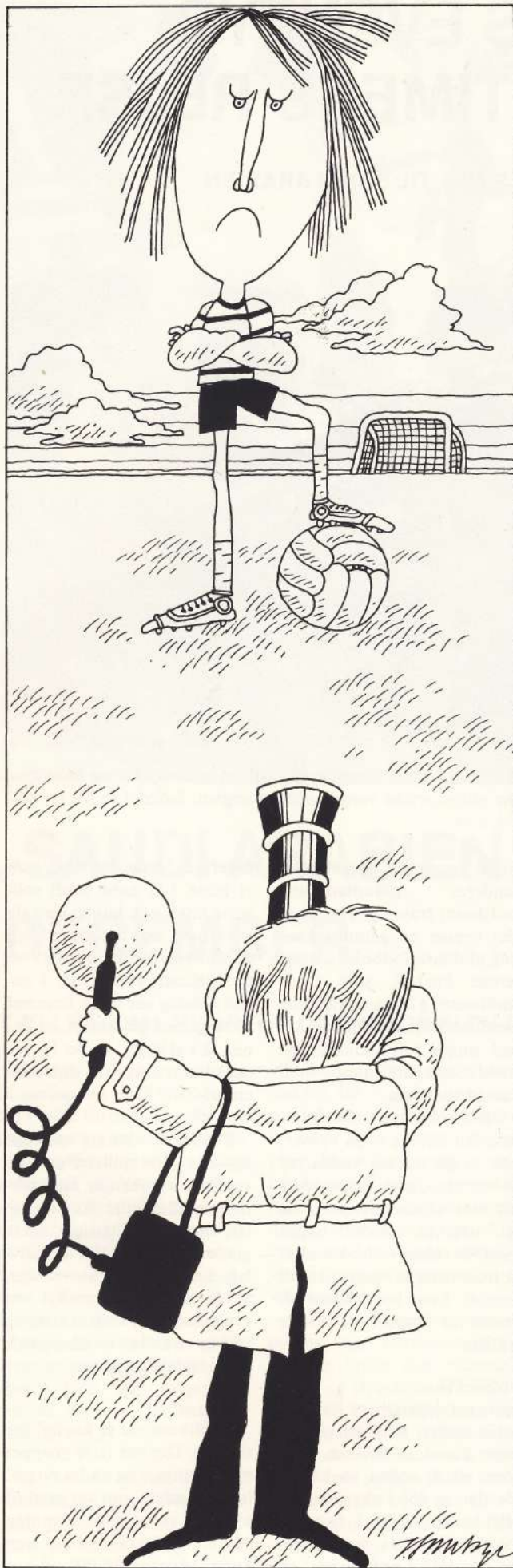
Tegning: Jørgen Saabye.

Denne tildragelse blev ret ironisk kommenteret i Ekstra Bladet, der insinuerede at vi ikke kunne kalde os amatører, hvis vi krævede penge til klubben, for vores medvirken. Journalisten, som havde skrevet notitsen, kunne i hvert fald ikke have tænkt sig særlig godt om. For det kan da ikke være hans mening, at det, at være amatør, skal være ensbetydende med at man skal stille sig til rådighed, hver