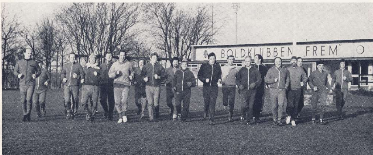
Så er motionisterne atter i sving. I ligbed med sidste år startede seniorafdelingen den 2. januar med træningen, og der har atter i år vist sig en stor interesse. Her går starten til den første løbetur.