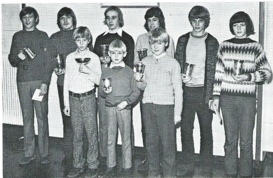
MODTAGERE AF FIDUS- OG TALENTPOKALER 1970

Vore bedste ynglinge tabte finalen til B1903 5-1. B1903 har ikke været vor livret i denne turnering – men vi ved af erfaring, at alle hold har en modstander, det være sig et top- eller bundhold, man ikke kan klare.