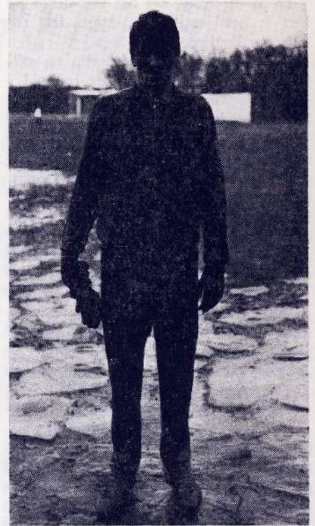
„Nej, det er ikke en mexicaner! Det er CURLEI“.

I week-enden før landskampen mod Mexico trænede mexicanerne på Frem's bane.