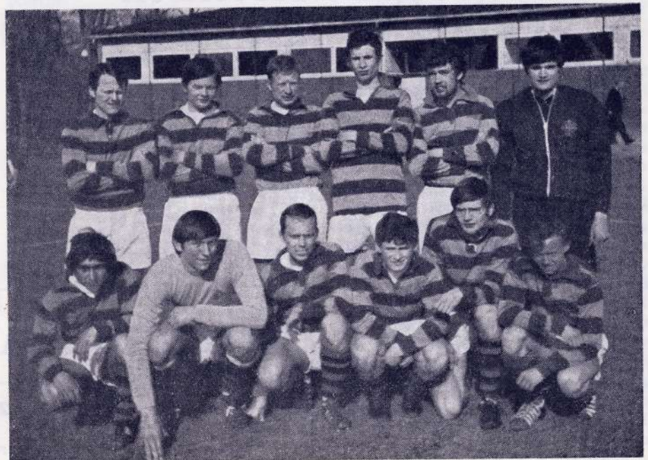
2. holdet på Køge Stadion.