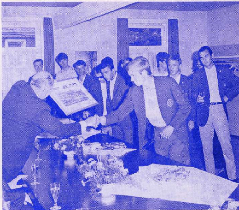
Fra modtagelsen hos borgmesteren i Berleburg

Nå, men vi skulle til at koncentrere os om fodbolden igen, selv om det var svært. Et par timer efter kørte vi ud til stadion, for at spille mod et forstærket hold fra Berleburg. Vi blev noget skuffede over at se, at det kun var en grusbane, men for at bøde lidt på det, skulle vi spille med en bold, der var grøn som en alpeost. Der var stor interesse for kampen, prinsessen har gjort god reklame for Danmark. Man havde i øvrigt sendt en forespørgsel til slottet om de kongelige ville komme og overvære kampen, men modtog et pænt brev om, at de desværre var optaget af barnedåb i København. Nå, men til selve kampen. Mens vi varmede op blev holdene annonceret i højtalerne, og her viste den tyske grundighed sig. Ikke blot blev alle data om Frem udråbt, men hver enkelt spiller blev annonceret med alder og antal klub- og landskampe. Man følte sig som en spiller på Real Madrids hold. Kampen endte 4-2 til os, så vi viste ansigtet til det sidste, selv om det var svært at mobilisere den rigtige kampgejst. Lettere blev det ikke for os ved, at vi faktisk spillede mod friske spillere hele tiden, idet vi havde givet lov til, at Berleburg