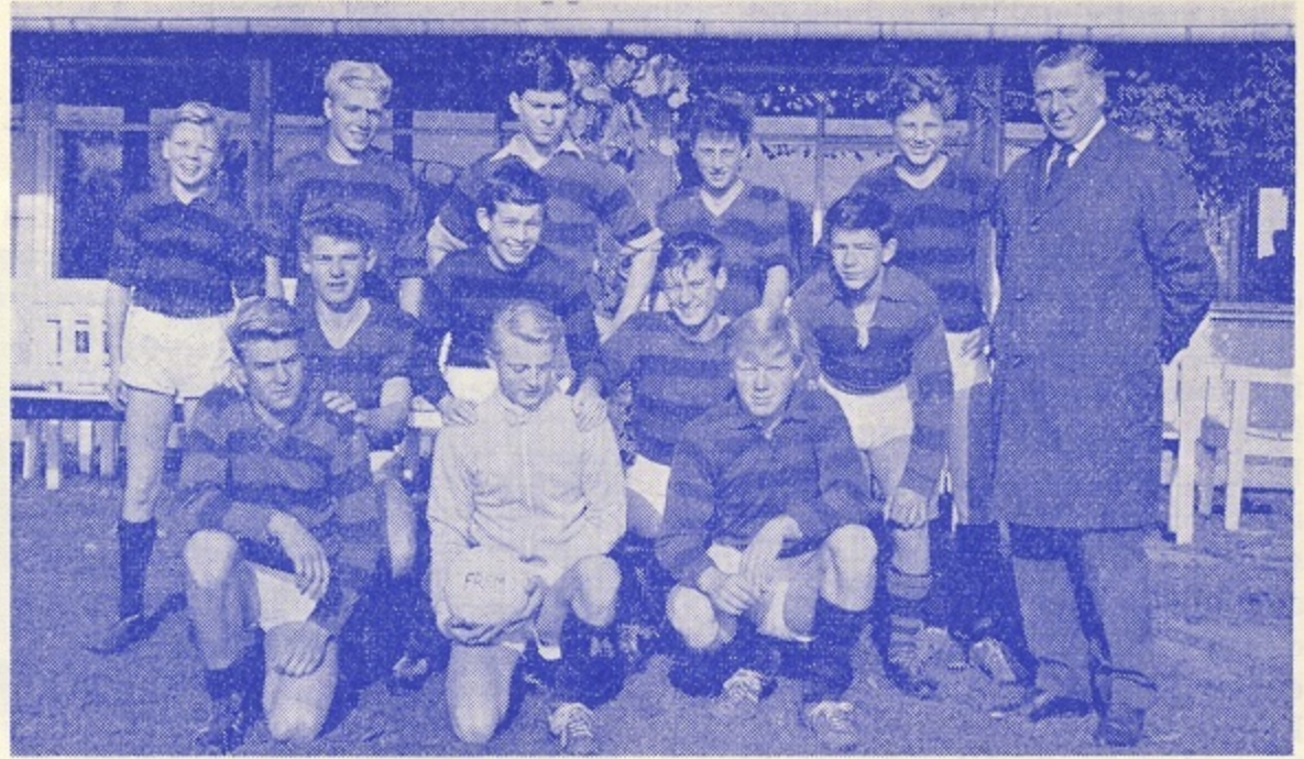
4. JUNIOR a. Turneringssvindere 1964.

1. Drengene var lidt af et problem. Efter en meget svag start i foråret kom der lidt gang i sagerne i efterårsturneringen, og man havde faktisk svært ved at tro, at det på et par undtagelser nær var samme hold som i foråret. Jeg har ikke tallet på de kampe, der er tabt 1-0 eller med 1 mål, men mon ikke jeg rammer plet, hvis vi gætter på 12 af de 18 turneringskampe. Som en opmuntring tævede vi rækkens nummer 1 og 2 i efteråret og beviste, at det var ganske unødvendigt at slutte som nummer 9. 2. Drengene a blev turneringsvinder, og ikke nok med det – de var afgjort afdelingens bedste hold. Fysisk ikke så velfunderede som 1. Drengene, men forståelse og de tekniske færdigheder var bedre – dertil en dejlig spillelyst, – og mon ikke flere af disse drenge vil være at finde på vore talenthold i fremtiden. De øvrige drengehold var på det jævne.