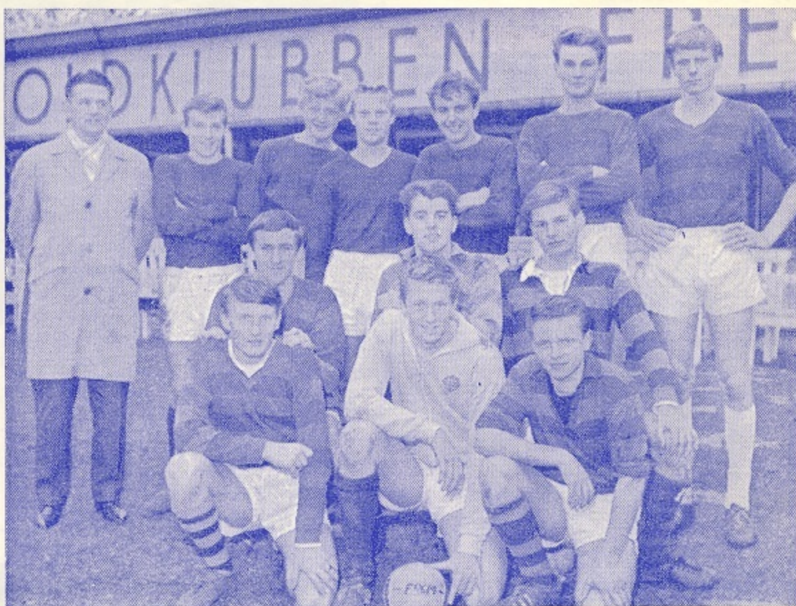
1. JUNIOR. Turneringsvindere og pokalfinalister 1964.