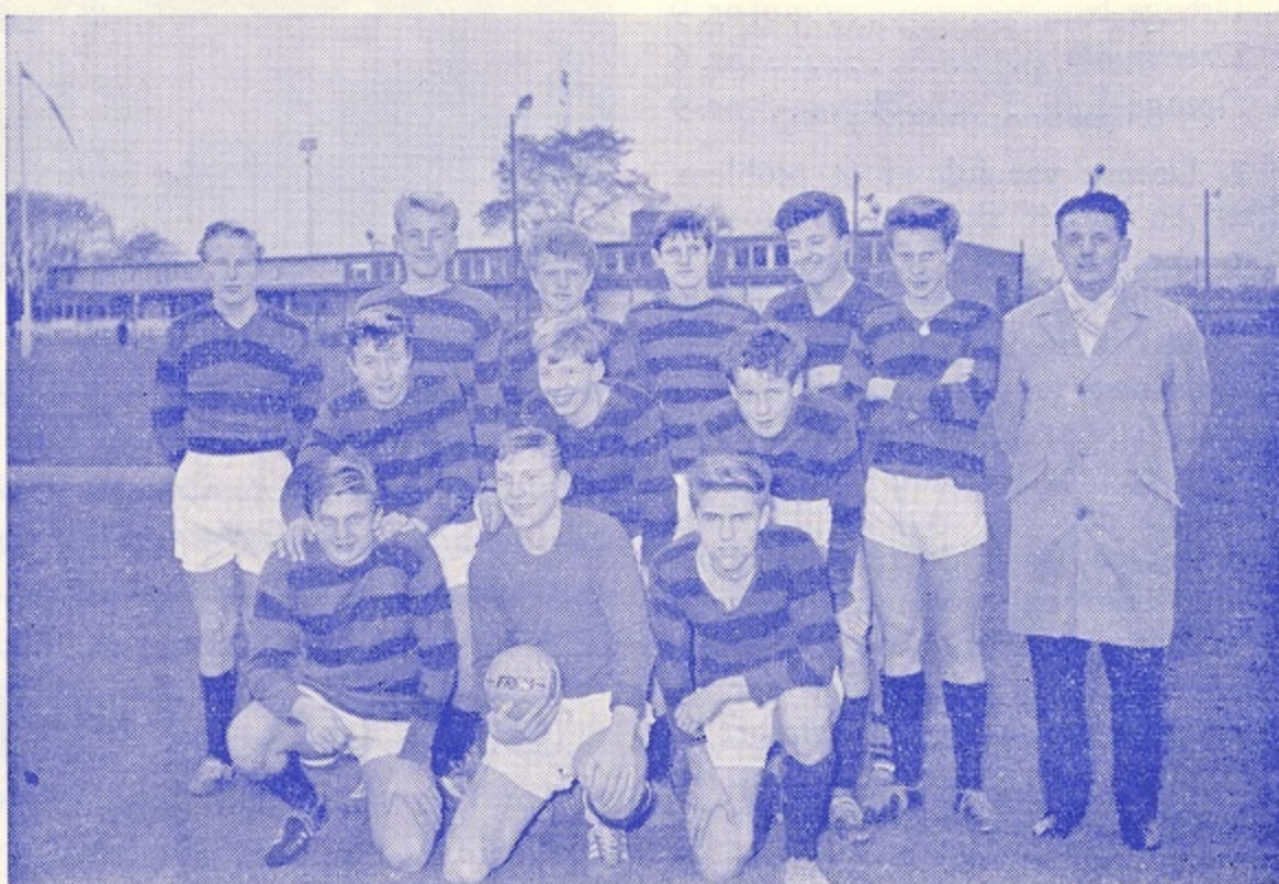
2. JUNIOR a. Turneringsvindere 1964.