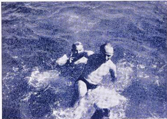
Vesty leger vandhund.

Til finalen maatte hver deltager saa inklinere for en dame, og hvert par skulle danse med en lille gummibold mellem de to partners pander.