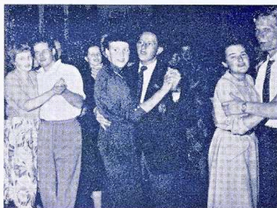
Og dansen gik...