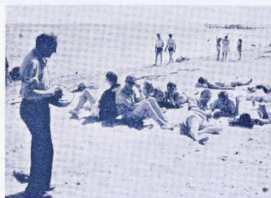
Er det »Sugar Bush«, der spilles?

Efter et utal af henvendelser til ledere og bestyrelse angaaende sommerturen, som vi spillere tilsidst ikke troede skulle blive til noget, lykkedes det os endeligt, ca. en uge før turen løb af stabelen, at faa noget at vide, bl. a. hvorhen turen gik. Maaske var der en anelse af skuffelse at spore hos flere af os, idet det oprindeligt var meningen, at sommerturen skulle gaa til Island , men det blev som bekendt ikke til noget. Da vi