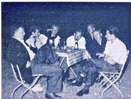
Hyggetime i den lune midsommernat...