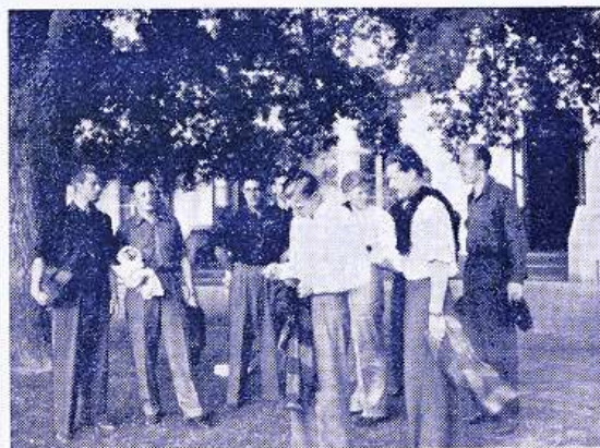
Der ventes paa »skiv«...

Normalt skulle aftenerne jo bringe lidt kølig-