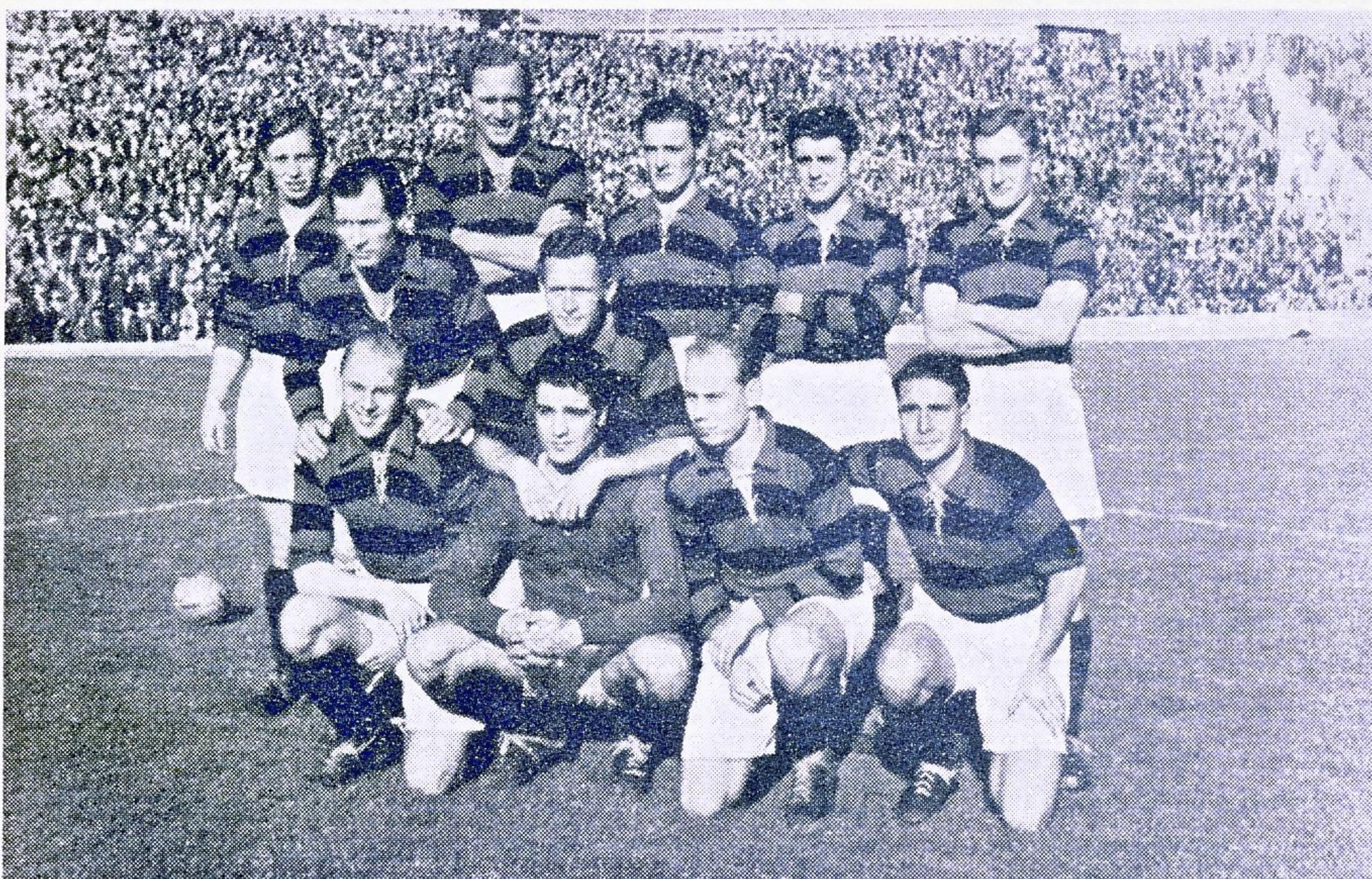
1. hold med gæster paa »Atletico«s store bane i Madrid.