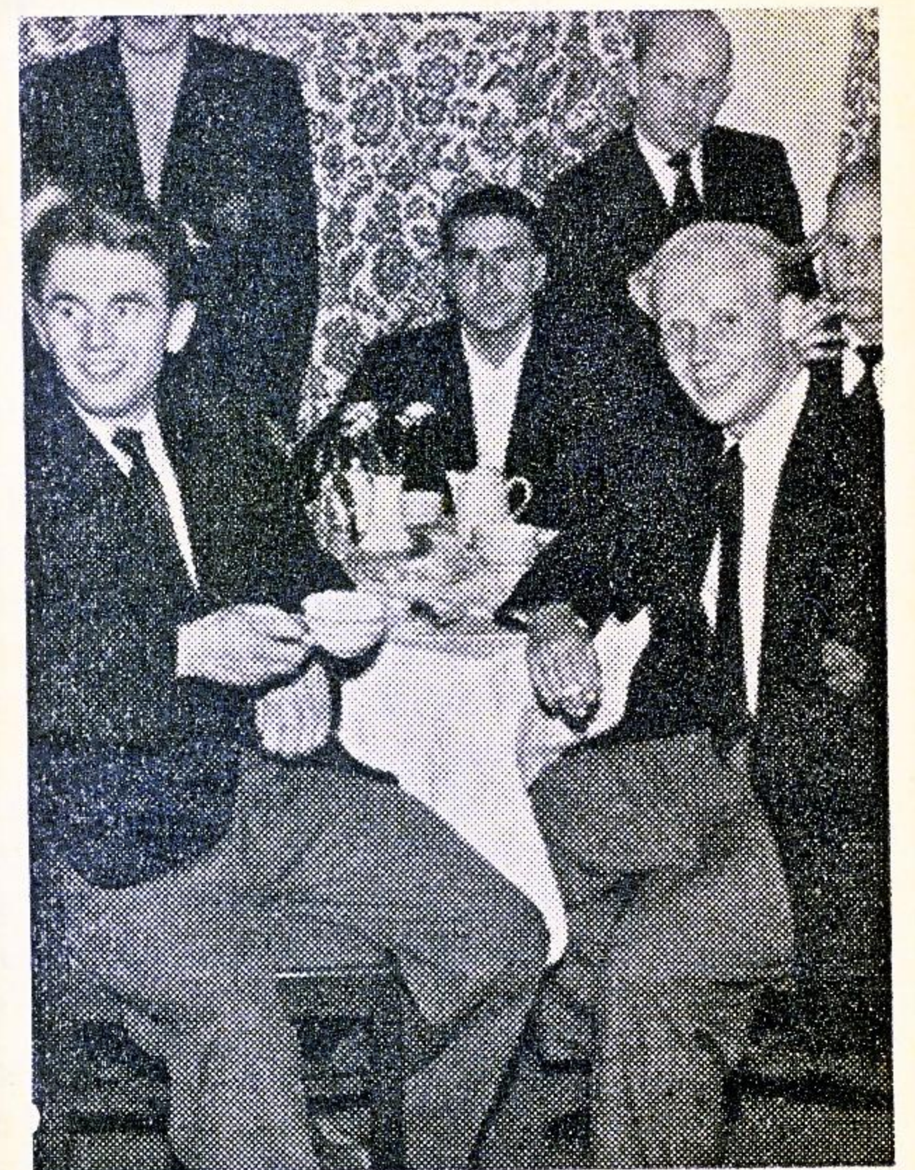
Tysklandsturen. Ved aftenkaffen.

Vi blev indkvarteret paa Centralhotellet, som laa side om side med det kendte »Rottefængerhus«. Da vi havde gjort os lidt i stand, gik vi ned og spiste — det var en behagelig overraskelse idet vi fik smørrebrød, en afveksling