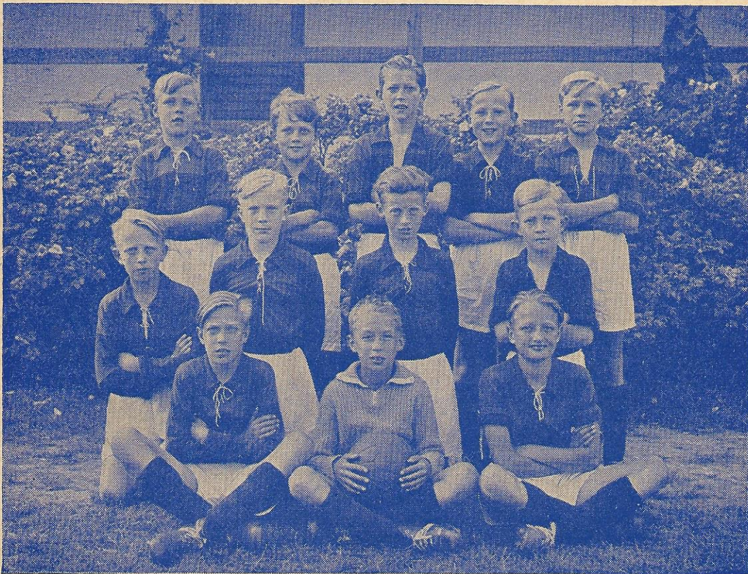
3. Lilleput. Turneringsvindere 1949—50.

Ogsaa vort allermindste og yngste hold vandt sin turnering, og her ser vi dem.