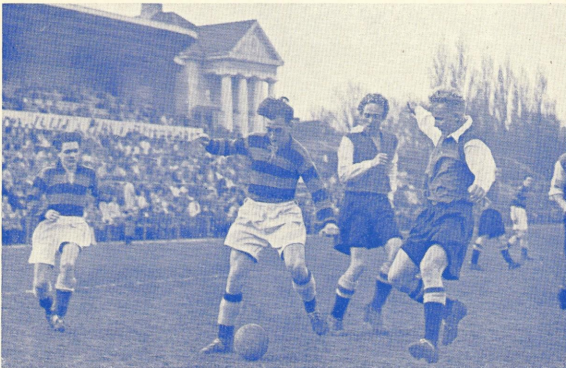
Fra foraarets sidste turneringskampe.