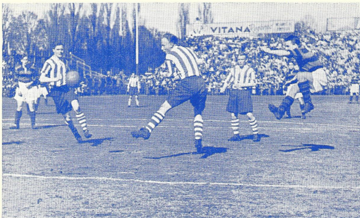
Frem—Esbjerg: (2—0). To nærgaaende skud.