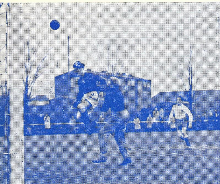
Og Olaf fik for meget »under i ballen«!

men forhaabentlig kommer de i tanker om, hvordan de bar sig ad paa ynglingeholdet med at lave maal, det vil altsaa sige, at de bare skal huske at skyde, som de gjorde tidligere, saa kommer resten af sig selv.