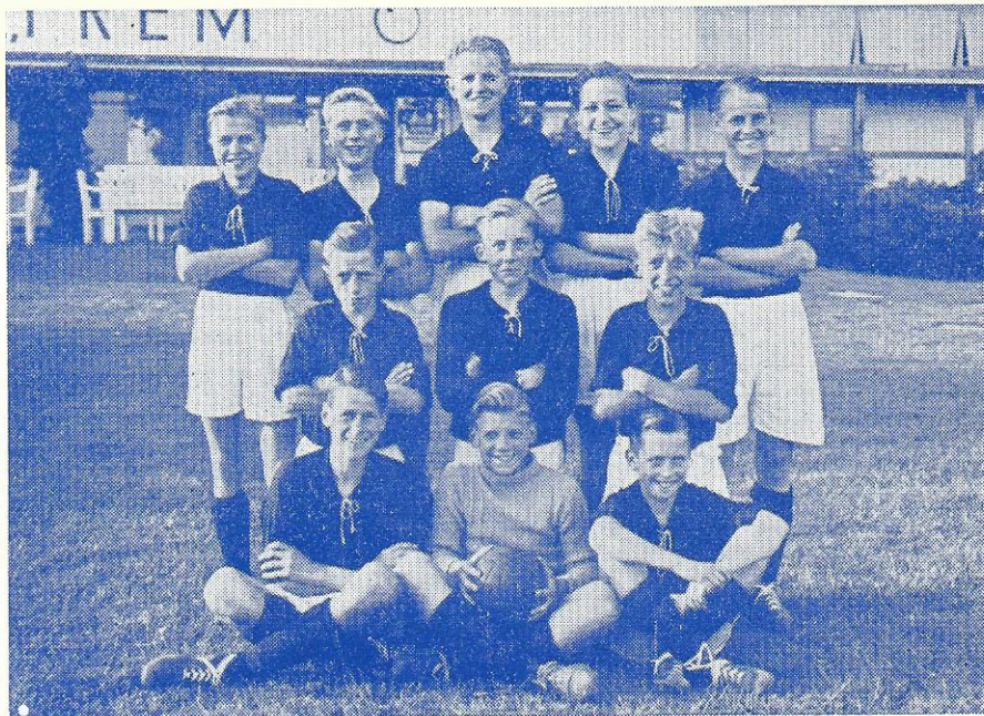
1. Drengehold. Pokalfinalist mod KB 1949

hold mere, saaledes at vi i indeværende turnering deltager med fire hold. Ydermere er materialet bedre end i adskillige aar — der er bredde i rækkerne, og jeg tror at kunne sige, at vore drenge i denne afdeling vil skaffe klubben mange smukke resultater. Foreløbig har holdene opnaaet følgende. 1. Ynglinge startede med, paa ABs bane, at sejre med 4 maal mod 0, og efter trænerens udsagn spillede de en fin kamp, hvor resultatet gav et udmærket billede af styrkeforholdet mellem de to hold. Sukces'en blev fortsat mod B 93, der blev besejret med 3 maal mod 1, men her var spillet knap saa godt — man havde