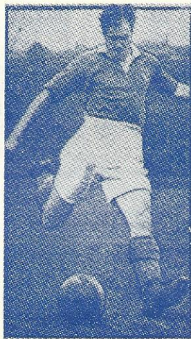
To Jimmy'er — Dickinson tv. — Scoular th.

»Jeg hader stjerne-systemet. Hvis det breder sig, vil det ødelægge spillet. Vi har ingen stjerner i Portsmouth — vi kan vinde uden dem paa grund