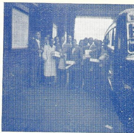
Afrejse fra Kings Cross, London.

Den medbragte mad spistes udendørs ved en gammel kro på Hampstead heath, og efter en