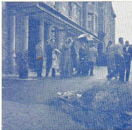
Udenfor »Pilstchry Hydro«.

Skotland afgik, Cook havde desværre glemt at reservere vore pladser, og det medførte, at vi kom med den sidste af tre afdelinger, og da toget på grund af oversvømmelser i Nordengland måtte tage en omvej, blev det en lang køretur, og vi kom først til Dundee kl. 2 om natten i stedet for kl. 22.