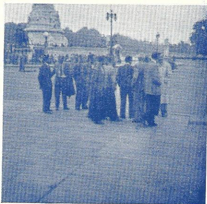
Ved Viktoriamonumentet udenfor Buckingham Palace.

Efter lunch gik turen til Wembley, hvor vi så Danmark slå Storbritannien i kampen om bronze-medaljerne. Straks efter kampen til lejren for