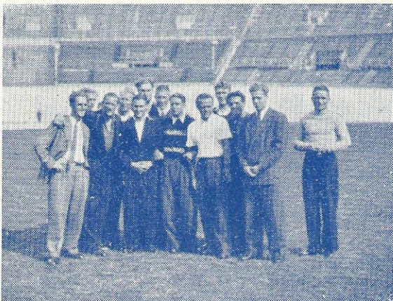
Holdet paa det olympiske Stadion.

10. Maj 1940 dræbte ca. 36.000 af Byens Indbyggere.