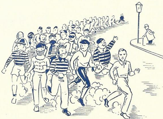
Konditionstræningen paa Landevejen.