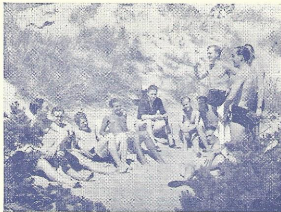
I Tylösands Klitter

Dagens andre Maaltider blev indtaget i Restaurantens store Spisesal med de store Vinduer mod Vest, hvorfra der er den herligste Udsigt over hele den lange Strand og over til Tyløen